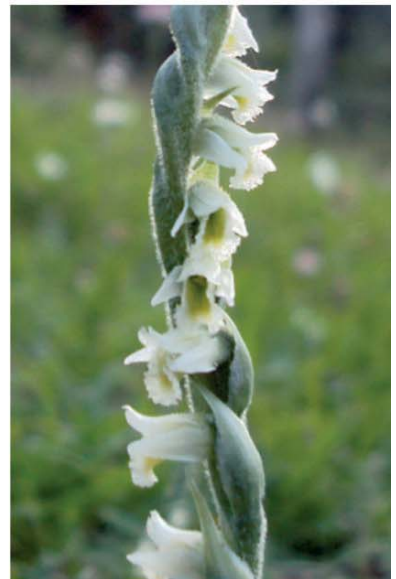
Planche couleur page 110, Figs. 20-28.