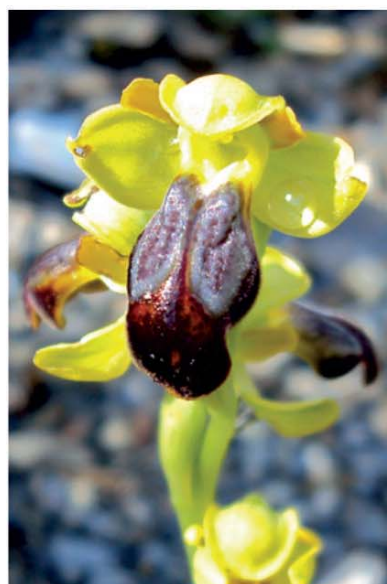
Planche couleur page 108, Figs. 2-10.