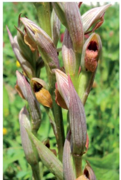
Planche couleur page 109, Figs. 11-19.