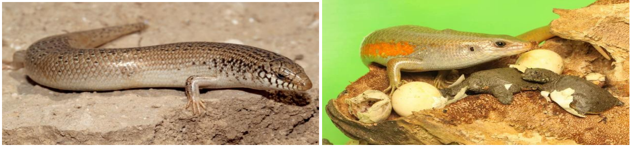
Abellehlah / Scinque ocellé