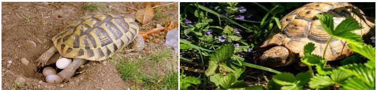
Ifker / Tortue d'Hermann