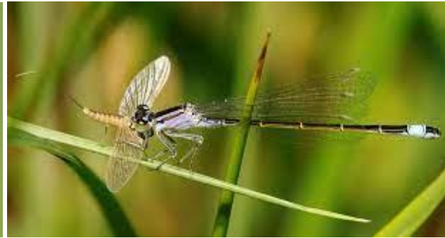
2 Mezzerÿel / Libellule