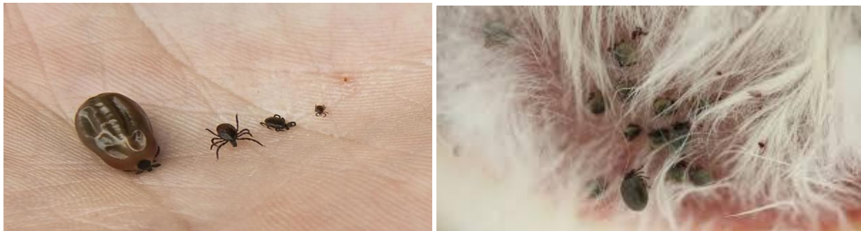
Aselluf / Tiques