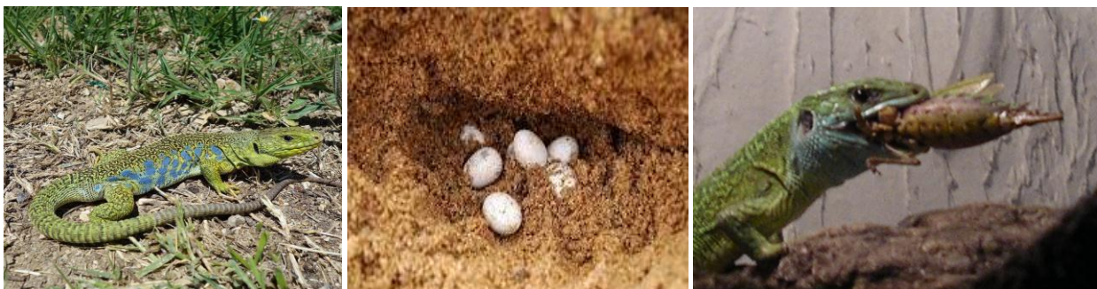
Amulab / Lézard vert