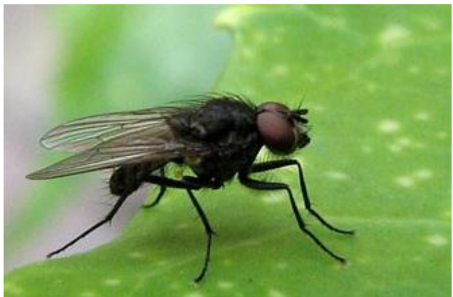
Izi n lexla / Mouche