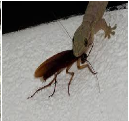
Tizermummect / Tarente