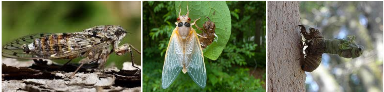
Tijjaq / Cicadidé