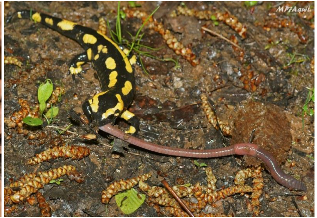
Taydest / Salamandre