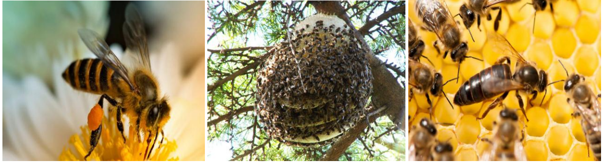
Tizizwit / Abeille