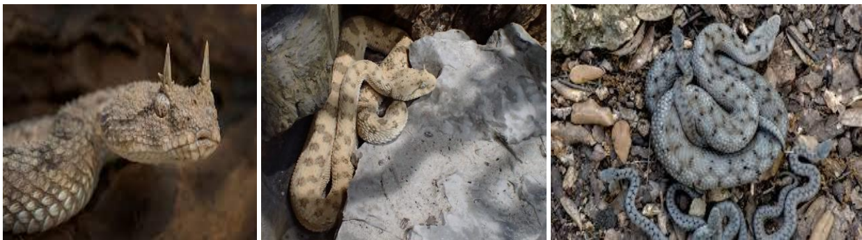
Amgel / Vipère à cornes