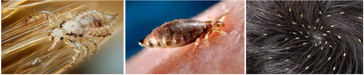
Tilict / Pou