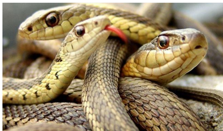
Izerman / Serpentes