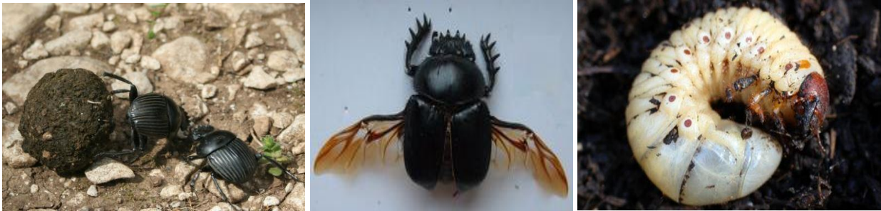
Abeqrur / Coléoptère, Tawekkiwt n Ubeqrur: Vers de coléoptère