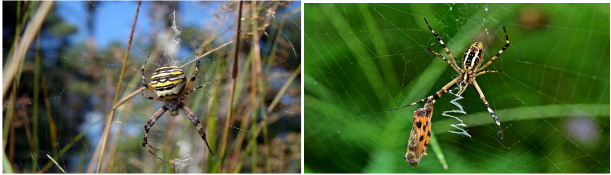
Rrtıla / Araignée