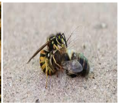
Taržezt / Guêpe terrestre