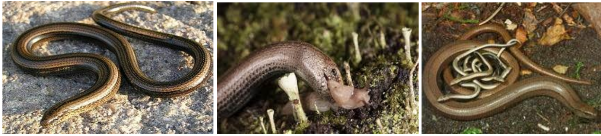
Aneccab / Orvet