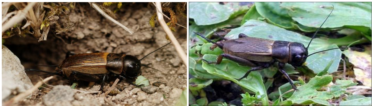
Abiryus / Grillon