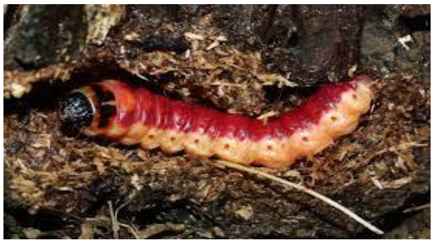
Bubcir, Tawekka / Cossus gâte-bois