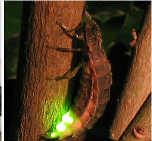
Tezrûreq / Ver luisant