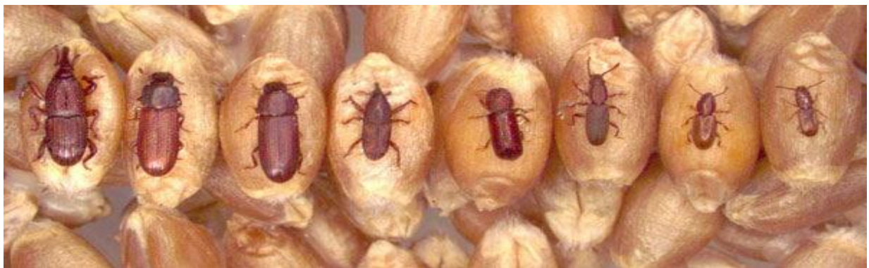
Akuz / Tribolium