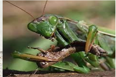
1 Tazegræyzt / Mantoptère