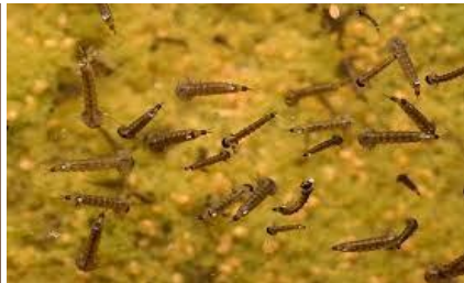
Nnamus / Moustiques