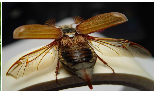
Izinzer / Hannceton