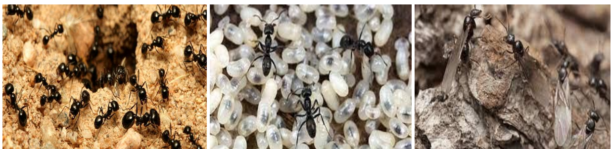
Aweṭṭuf / Fourmis, Aberriq / Fourmis aillées