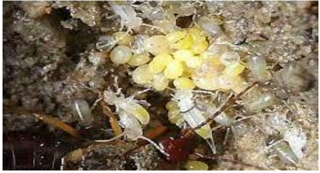
1 Menzel / Perce-oreille