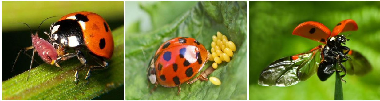
Abagguz / Coccinella