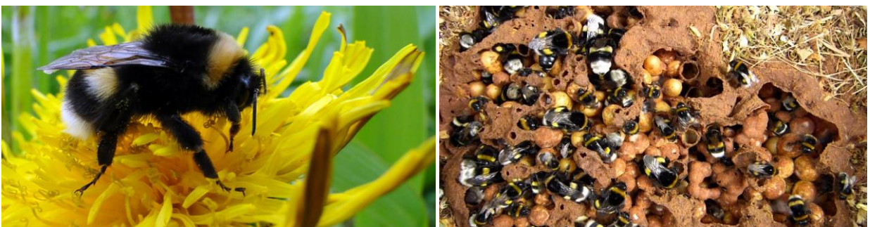
Abuzhar / Bourdon