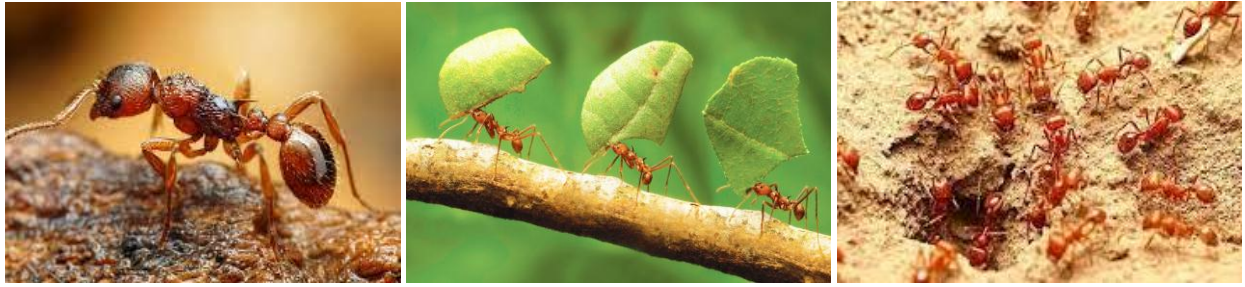
Awεεuf azeggay / Fourmi rouge des arbres