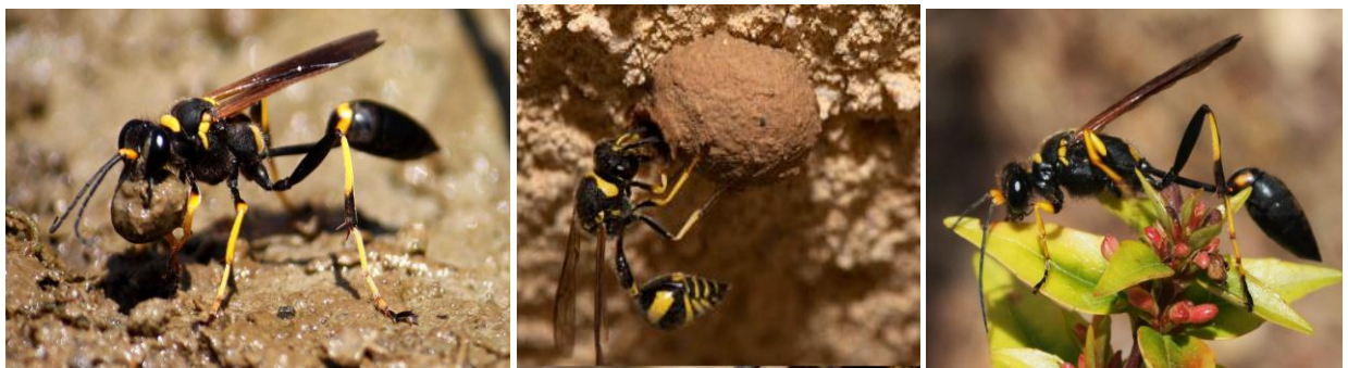
Σli Abennay / Guepe maçonne