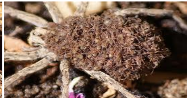
Tabyaynuzt / Lycosse de Narbonne