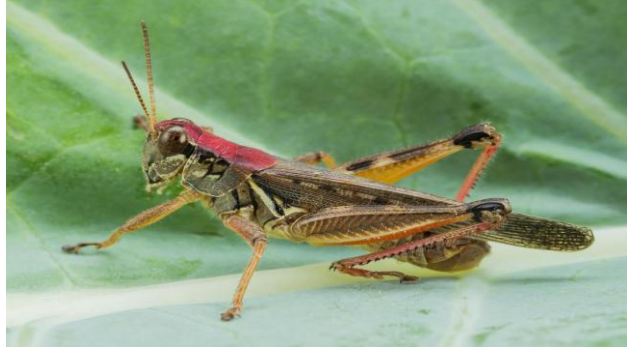
Abziz / Criquet