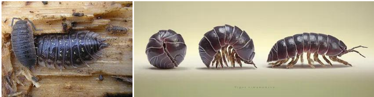
1 Zirbu / Cloporte