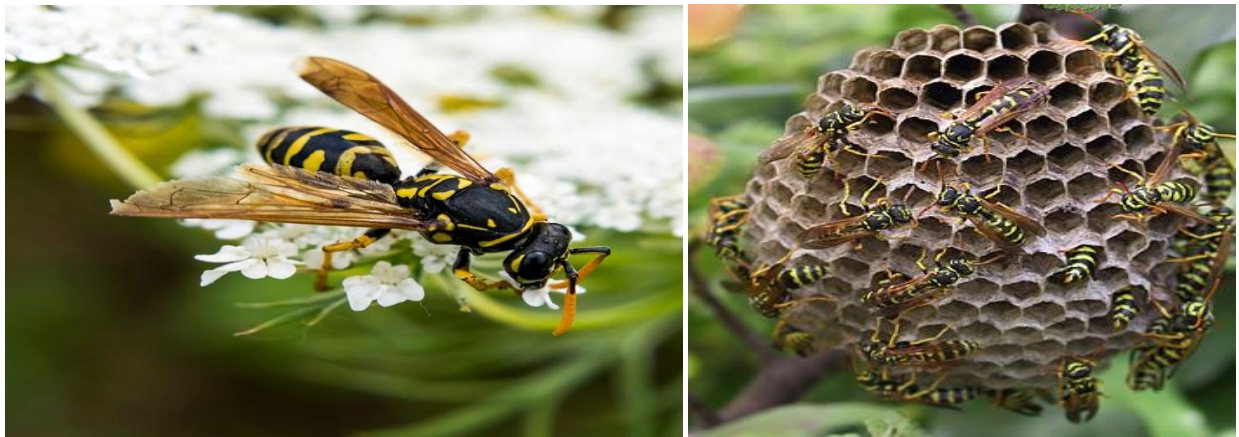
Arzez / Guêpe zébrée