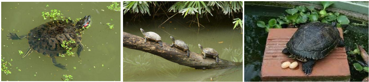
Afekrun /Tortue d'eau