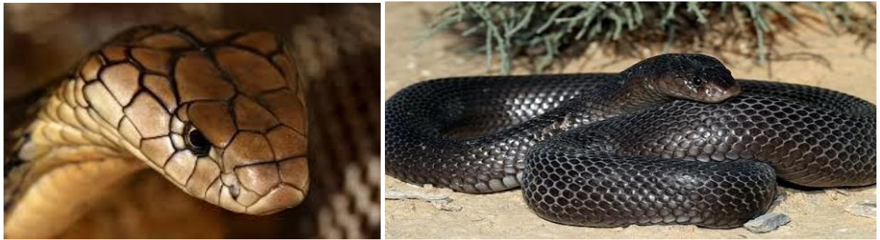
1 Ifiyer / Cobra