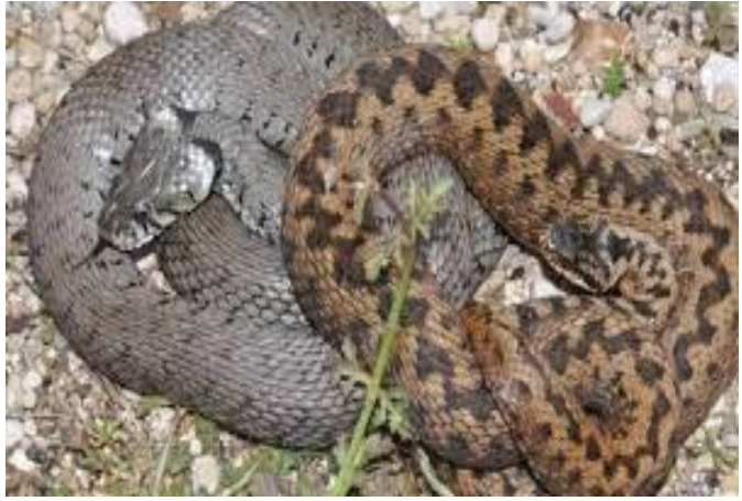
Talafsa / Vipère aspic