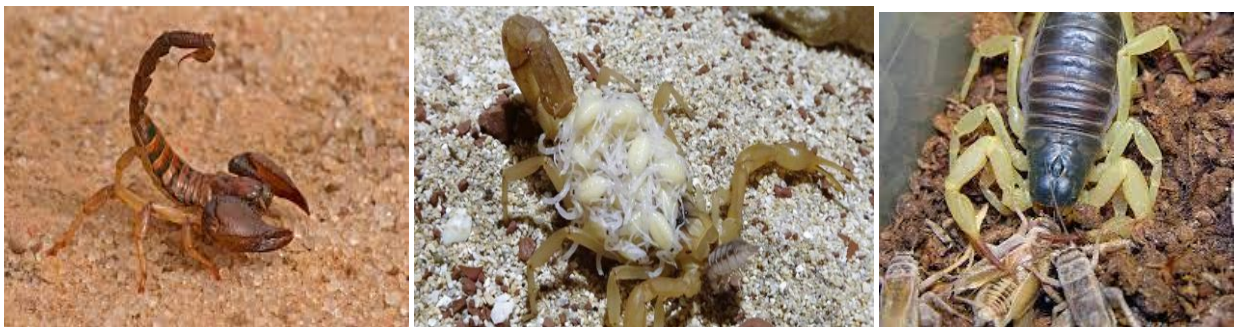
Tiyirdemt / Scorpion