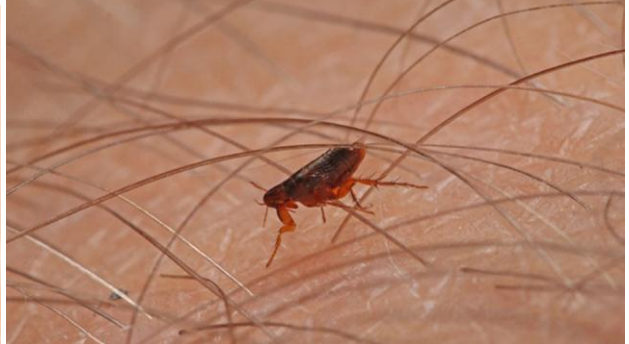
Akured / Puces