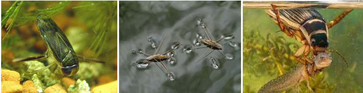
Timerdeddac / Corixidaes