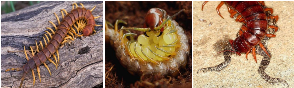
Timest n waçu / Centipèdes