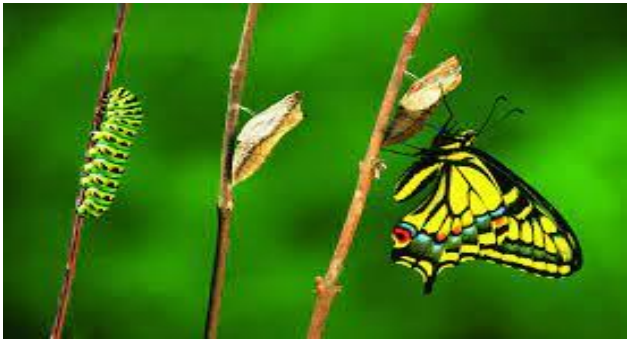
Aferetıtu / Papillon, Aburbu / Chenille