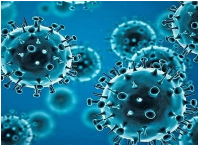
الشكل رقم 1: صورة تمثل فيروس كورونا (كوفيد19).

وهذا المرض يشبه سلالة جديده من الفيروسات التاجية تم التعرف عليها لأول مره في وهان في الصين وصنف كوفيد 19 لأنه جائحه ليس مؤثرا على ان الفيروس أصبح أكثر بل هو اعتراف باتساع ماذا الانتشار الجغرافي للمرض.1