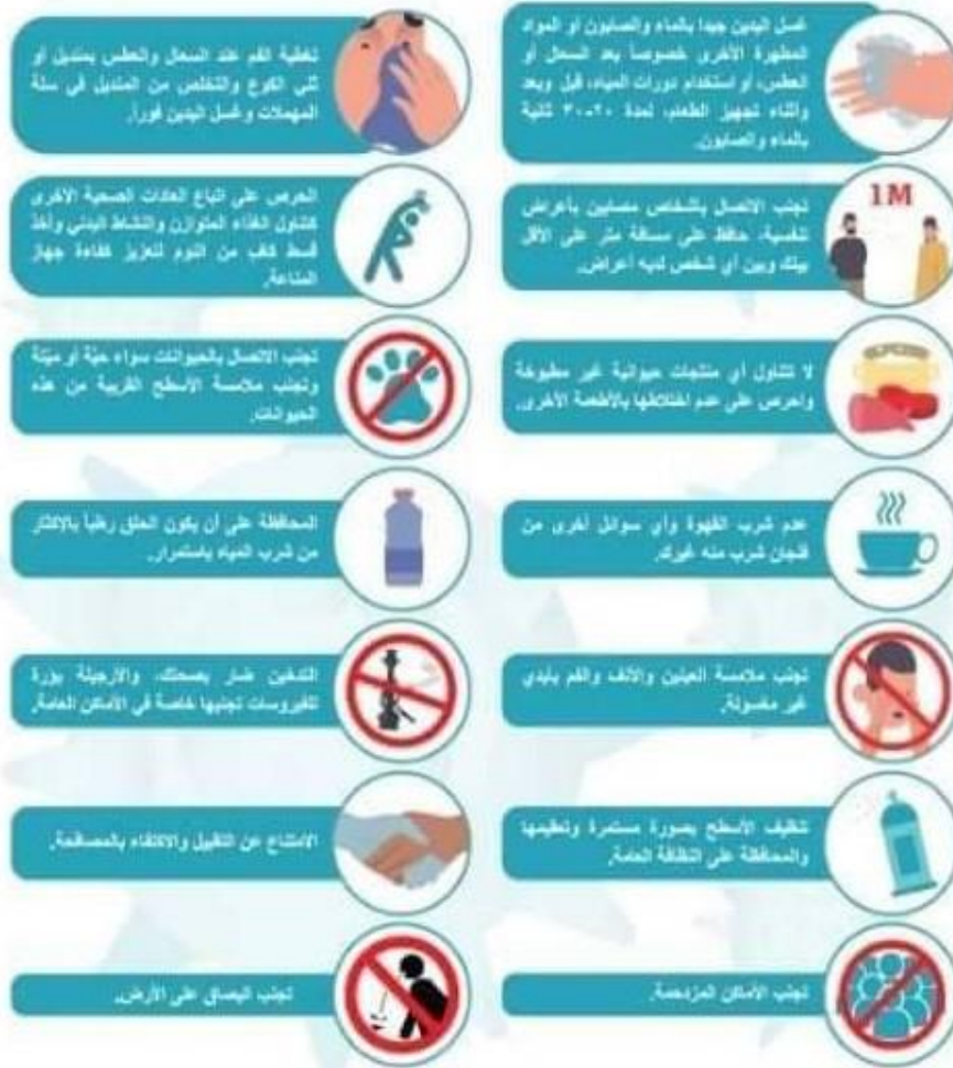
-الشكل رقم 2: صوره تبين طرق الوقاية من فيروس كورونا 19.