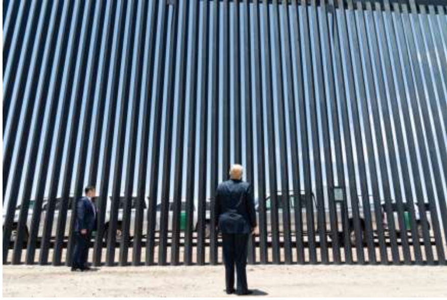
الصورة رقم(05): تبين (DJT) وهو ينظر إلى أعلى الجدار

الصورة أيضا احتوت على شخصية أخرى لا تقل أهمية، وهو أحد الحراس الشخصيين للرئيس الأمريكي، فهو بمثابة حزام الأمان.