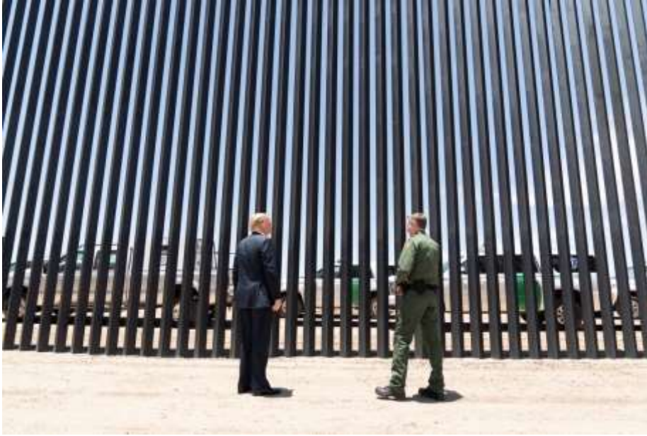
الصورة رقم(03): توضيح (DJT) مع مرافقه أمام الجدار

يرتدي ترامب في هذه الصورة بذلته السوداء وربطة عنق حمراء، تضيي الرّسمية للجولة التي أجراها الرّئيس إلى الحدود الجنوبية، يظهر وهو في حديث مع مرافقه من الجنود الأمريكيين الذي يرتدي بذلته العسكرية، والأرجح أن يكون الحديث حول ضرورة استكمال بناء الجدار.