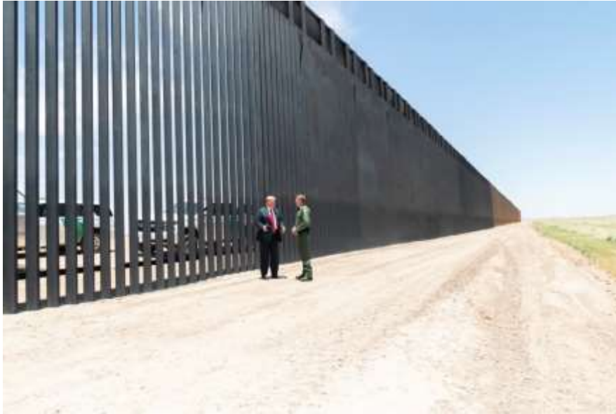
الصورة رقم(04): توضيح (DJT) في حوار مرافقه أمام الجدار

يرتدي ترامب في هذه الصورة بذلته السوداء وربطة عنق حمراء، تضيي الرّسمية للجولة التي أجراها الرّئيس إلى الحدود الجنوبية، يظهر وهو في حديث مع مرافقه من الجنود الأمريكيين الذي يرتدي بذلته العسكرية، والأرجح أن يكون الحديث حول ضرورة استكمال بناء الجدار.