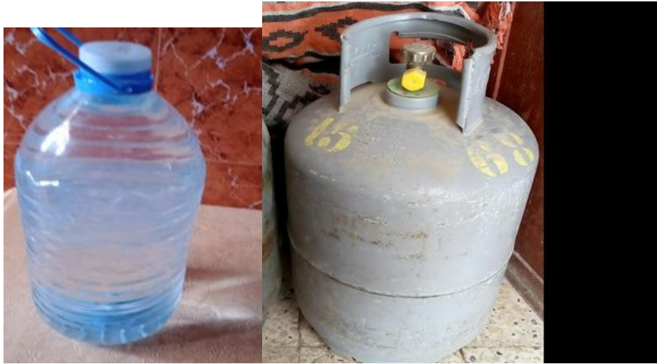
Taqareunt Taqareunt n lgaz