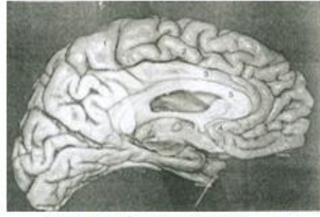
الشكل (2): منظر وسطي للفصوص الجبهية

Van der linden, M. et al. المصدر Neuropsychologie des lobes frontaux , Solal, Paris, 1999, p. 15.