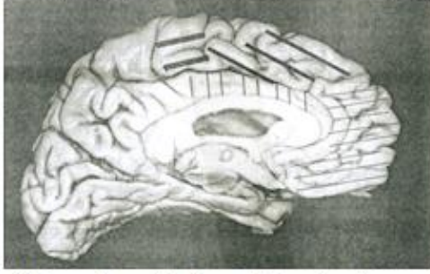
الشكل (05): منظر وسطي للفصوص الجبهية

Van der linden, M. et al. المصدر Neuropsychologie des lobes frontaux , Solal, Paris, 1999, p. 17.