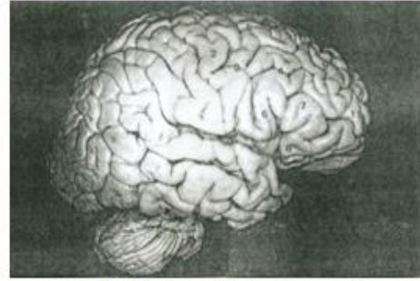
الشكل (1): منظر جانبي للفصوص الجبهية

Van der linden, M. et al. المصدر: Neuropsychologie des lobes frontaux , Solal, Paris, 1999, p. 14.