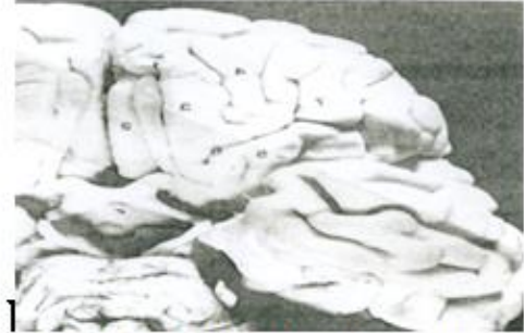
الشكل (3): منظر سفلي للفصوص الجبهية

Van der linden, M. et al. المصدر Neuropsychologie des lobes frontaux , Solal, Paris, 1999, p. 16.