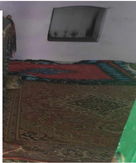
التقطت الصورة بعاً البية يوم 24 جوان 2024م.