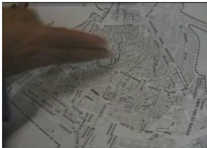
Figure 2 : Geste illustrant la limite

Au-delà de la délimitation des espaces, nous avons remarqué lors des tests des manières de tracer les itinéraires et les parcours. Certains utilisent des mouvements circulaires, d'autre reproduisent des formes carrées ou triangulaires alors que d'autres mettent des points de repères sur la carte. S'ajoute à cela, la ponctuation du discours par les mains comme le geste de martellement en disant qu'il y a un dinandier dans la rue ou faire un geste de coupure pour dire que c'est une impasse ...etc. Toutes ces données peuvent nous renseigner sur la conception de la perception environnementale et sur les représentations spatiales, voici quelques image sur lesquelles nous pouvons retrouver des gestes qui ponctuent le discours de nos enquêtés :