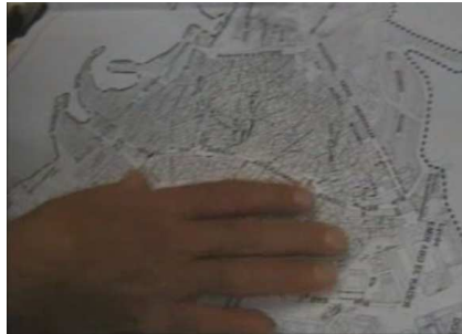
Figure 3 : Geste marquant un territoire

Un autre questionnement a animé notre curiosité : celui de la manière avec laquelle les enquêtés reconnaissent-ils la vraisemblance des tracés topographiques, des ruelles et de leurs formes. Nous avons hésité quant à l'usage d'une carte muette ou une carte avec armature géométrique et légendes mais nous avons fini par proposer la seconde car l'usage des cartes en Algérie est très rare, nous n'avons pas la culture des cartes, aucun organisme n'en offre gratuitement et quand c'est le cas 3 , la quantité est insignifiante ou les données qu'elles fournissent sont discutables. Prenons un simple exemple : récemment le Ministère de l'Aménagement du Territoire, de l'Environnement et du Tourisme a proposé deux circuits touristiques pour visiter la Casbah « par le haut » ou « par le bas » les voici :