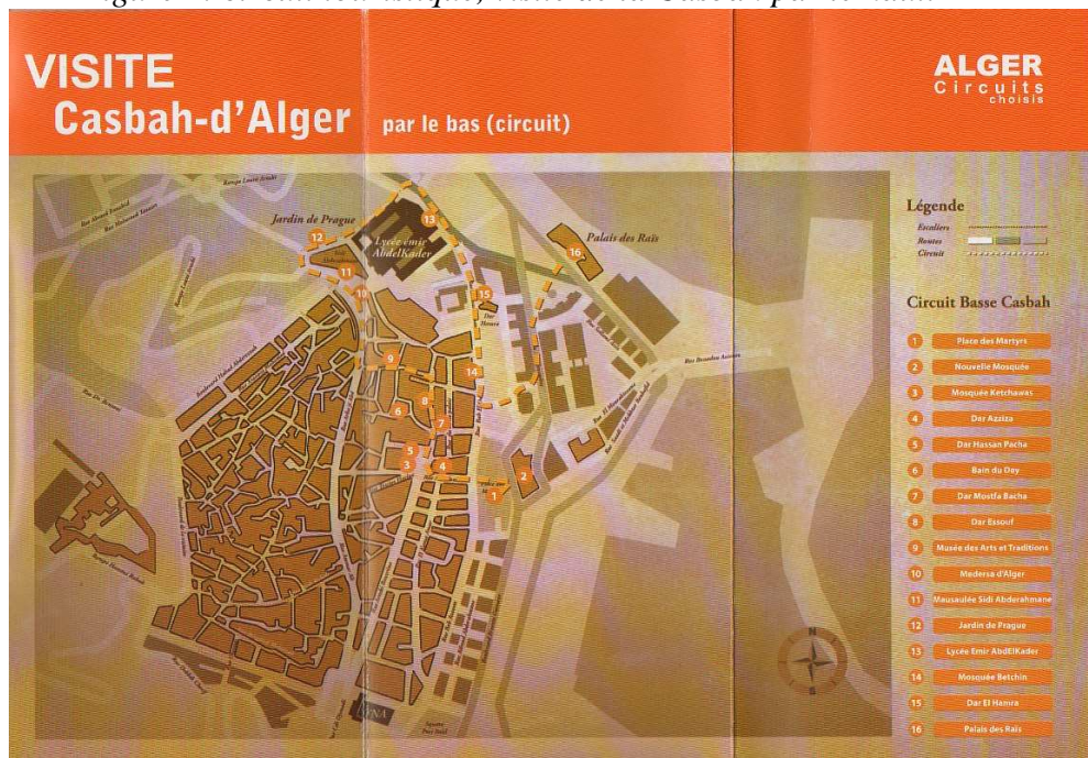
Figure 5 : Circuit touristique, visite de la Casbah par le bas.