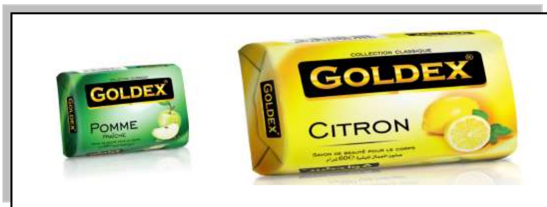
Figure 4 : savon barre GOLDEX.