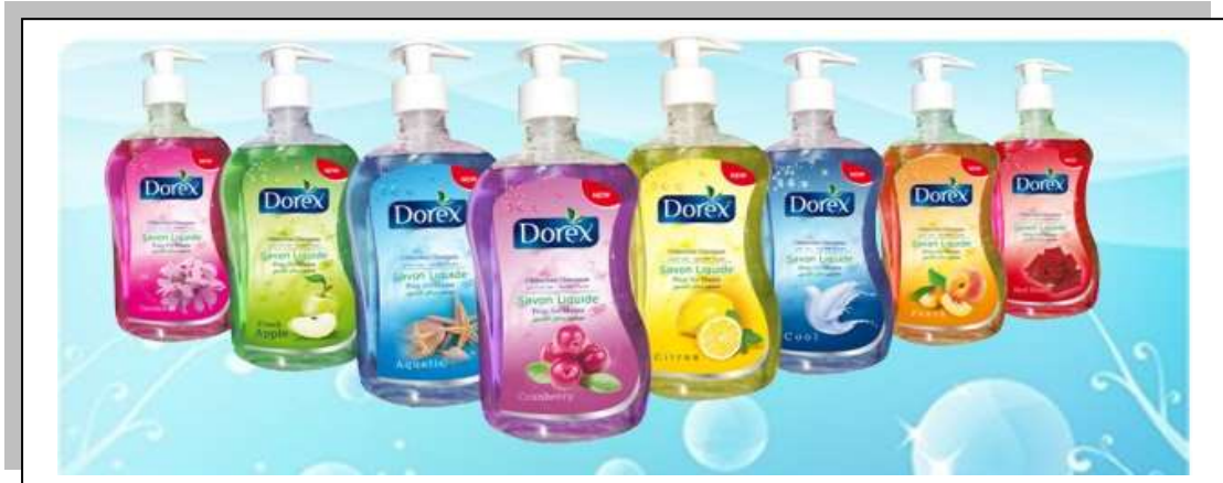
Figure I.5 : liquide main classique.

AL WAHA est passée à la production de shampooing DOREX , liquide main et liquide vaisselle de standard international, puisqu'elle a acquis pour cela des machines modernes ainsi que des processus parfaitement adaptés aux normes et aux exigences du marché algérien.