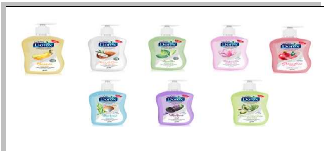
Figure I.6 : liquide main creamy.