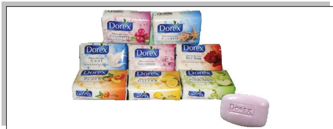
Figure I.3 : savon barre DOREX.

L'entreprise fabrique principalement les savonnets d'origine Algérienne DOREX et GOLDEX , sous leurs différentes formes et parfums de la gamme économique à la gamme luxe.