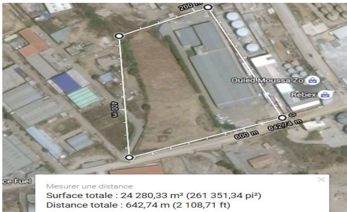
Figure I.2 : Situation géographique de l'entreprise.