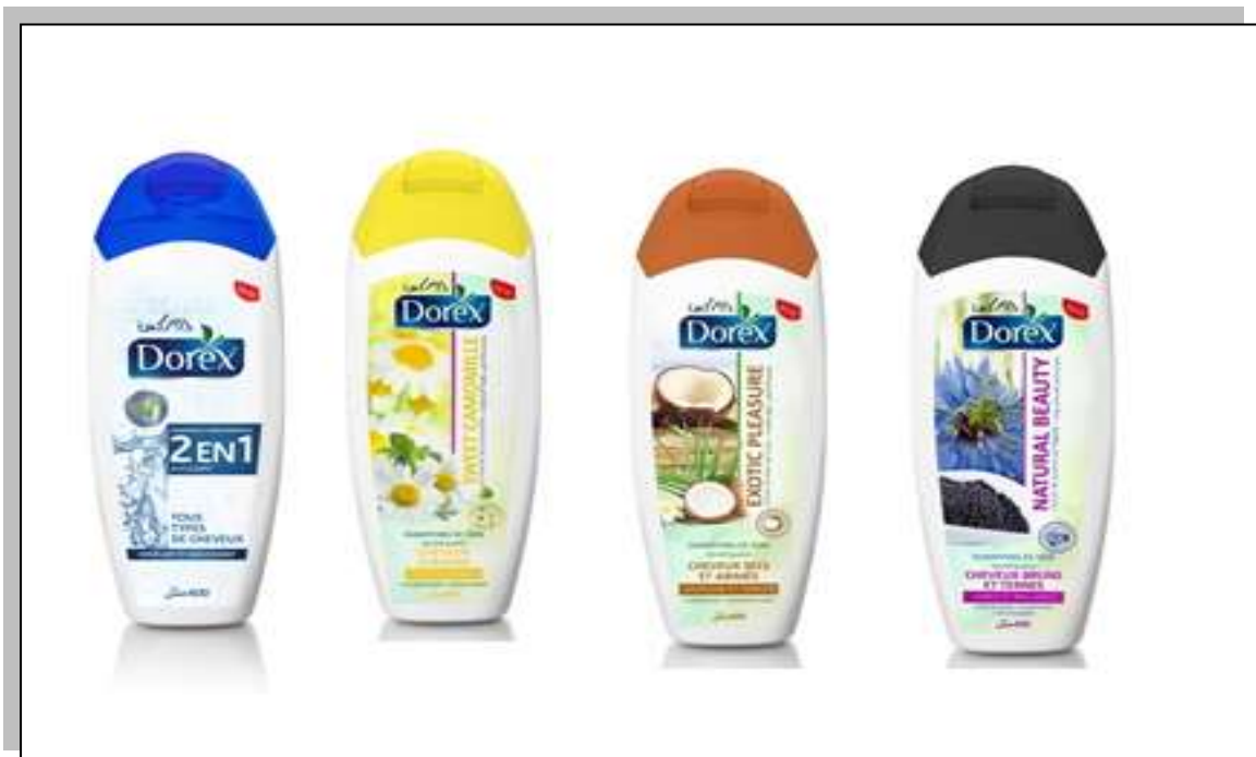
Figure I.8 :shampoing DOREX.