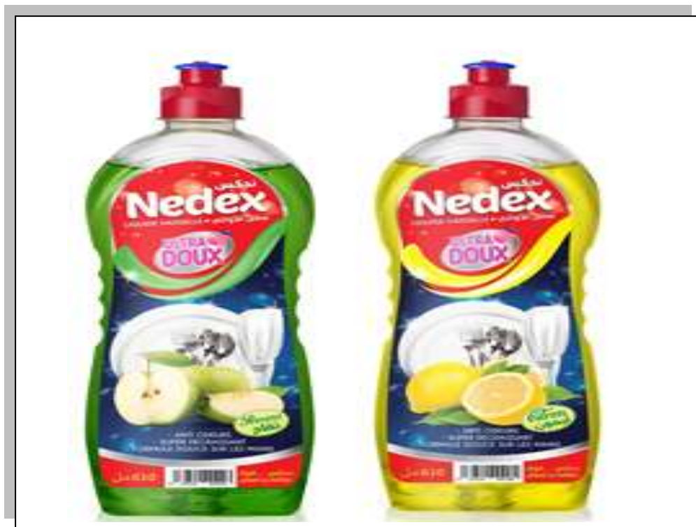
Figure I.7 : liquide vaisselle.