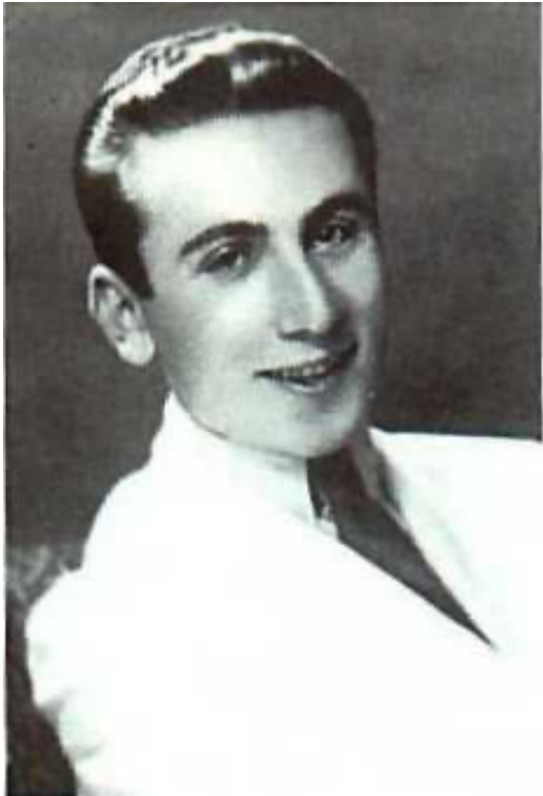
طالب في التي الحقوق دمشق، ١٩٤١